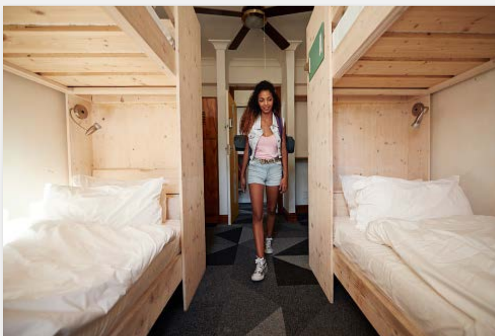
Hostels, una modalidad de alojamiento en crecimiento.