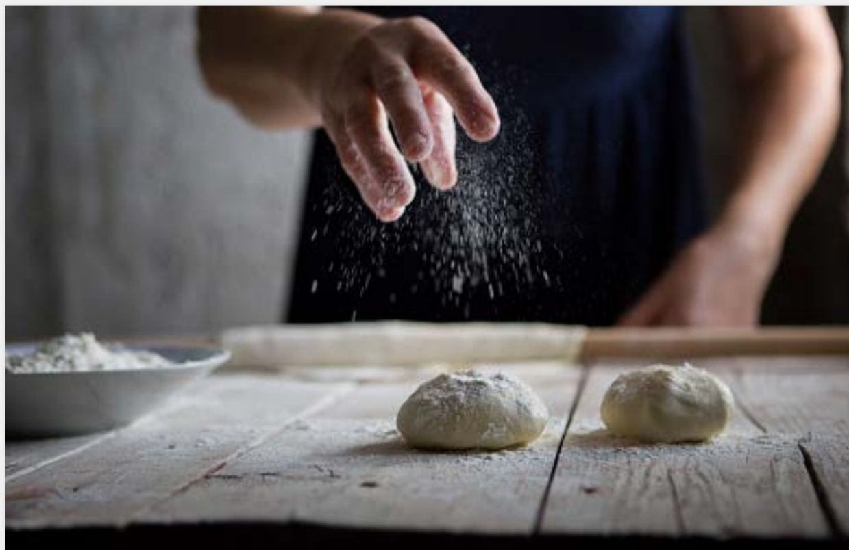
Cooking classes, una experiencia cada vez más demandada por los visitantes.