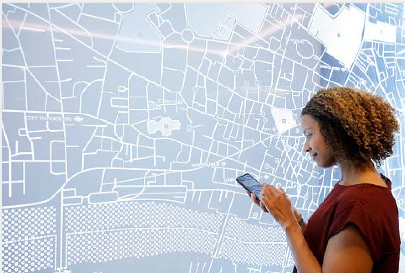
El uso de dispositivos móviles permite obtener información útil para la planificación del turismo.