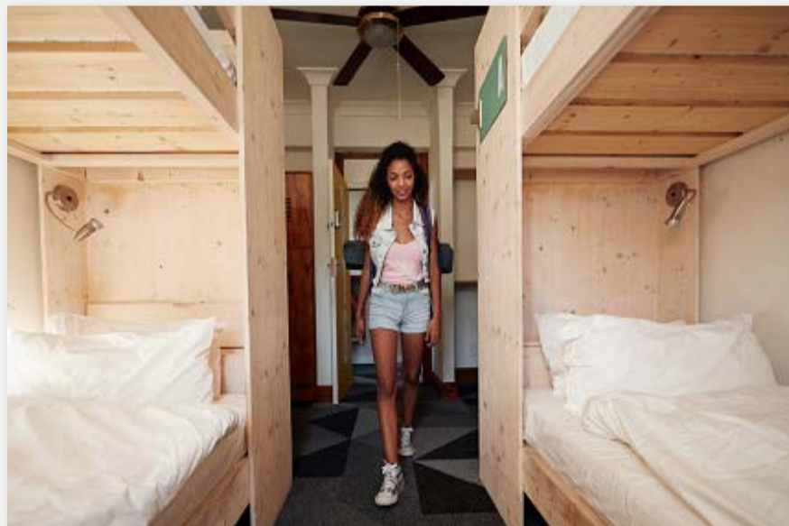
Hostels, una modalidad de alojamiento en crecimiento.