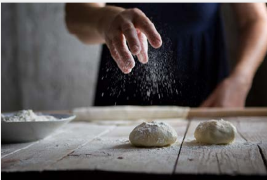
Cooking classes, una experiencia cada vez más demandada por los visitantes.

Si realizan búsquedas en internet, recuerden prestar atención a la fiabilidad de los sitios consultados ( ver actividad 1 ).