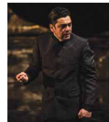
Ajaka dirigió Los Rotos , un grotesco fantástico, durante la temporada 2018 de El Cultural.

Ajaka, que comenzó a estudiar teatro a los 28 años con Ricardo Bartís, escribió la obra inspirándose en una serie de disputas y situaciones barriales, a las que además