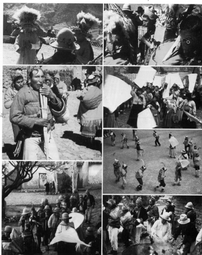
Imágenes de las distintas agrupaciones registradas ( litchiwayus, sikuris, julajula y wiphalas )

El ejemplo sonoro que traemos hoy es un “Wayño Chiriwano” que se toca en la Fiesta de Nuestra Señora de la Candelaria/Fiesta de la Purificación de la Virgen