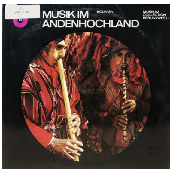
Tapa del disco Musik im andenhochland/bolivien Museum Colecttion Berlin (West) Primera Edición 1982

Escanee el siguiente código QR o de CLICK AQUÍ y escuche el fragmento sonoro que representa la reseña.