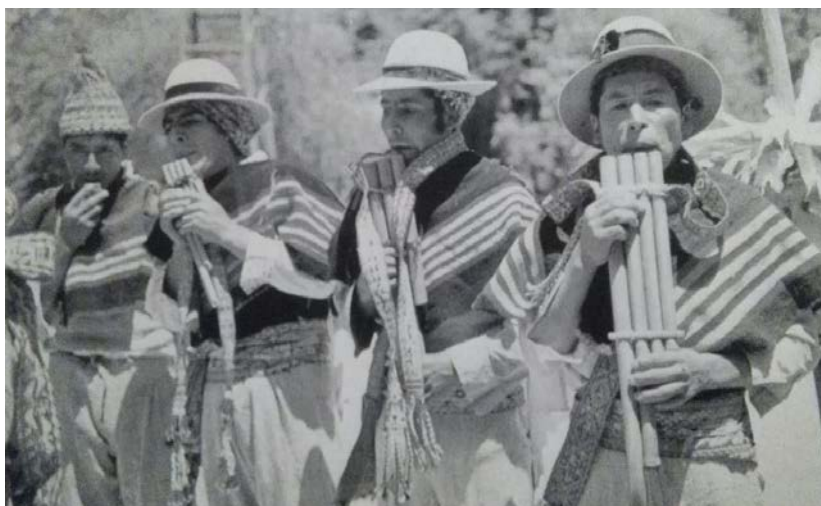
Chiriwanos de Ayopaya en la de Nuestra Señora de la Candelaria/Fiesta de la Purificación de la Virgen Bendita (2 de febrero)

Meincke nos aclara también que hay diferentes tipos de Chiriwanos que se pueden encontrar en diferentes zonas de Bolivia como en La Paz, Cochabamba y Oruro, en Chile se encuentran en Chiapa que es una localidad situada en la Región de Tarapacá, Provincia del Tamarugal, Comuna de Huara y en Perú, se encuentra en algunos pueblos del Dpto. de Puno como en Huancané al norte del lago Titicaca.