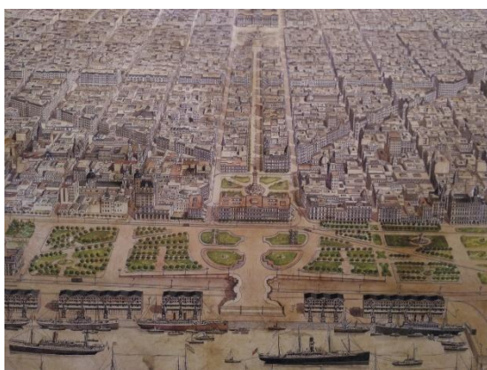
Preservación del Eje centro histórico de la Ciudad. 1915 – Buenos Aires a vista de pájaro. Jean Desiré Dulin.

Su calidad de escenario urbano, soporte material de múltiples actividades culturales y recreativas, vuelve a esta pieza un hito convocante en el Eje Cívico Histórico de la Ciudad.