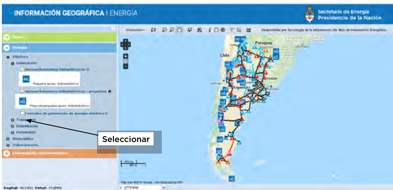
Figura 2. Las centrales de generación de energía eléctrica están inactivas en el mapa mientras que permanecen representados los aprovechamientos hidroeléctricos.